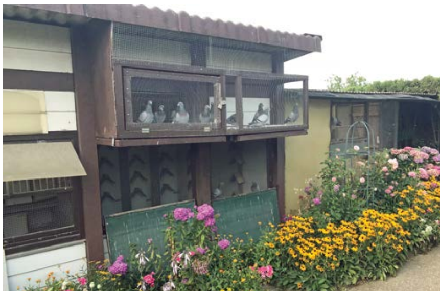
Die Vorderfronten der Schläge sind ganzjährig zu großen Teilen offen und mit Drahtgeflecht versehen. Diese Öffnungen werden auch nachts oder an feuchten Tagen nicht geschlossen.